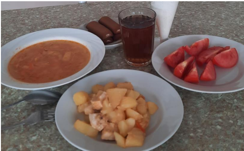
Обед ОВЗ 6.09.2024