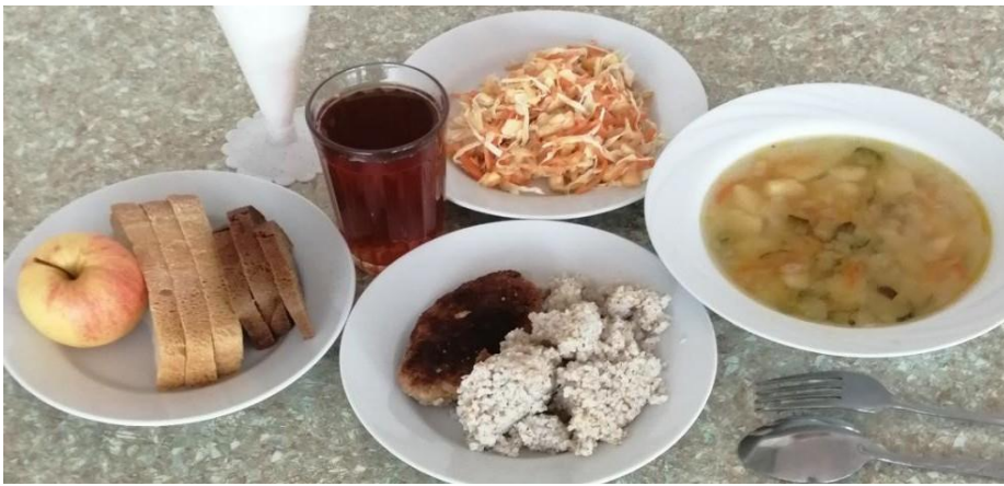
Обед ОВЗ 19.09.2024