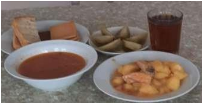
Обед ОБЗ 20.12.2024