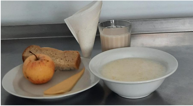
Завтрак 9.09.2024 г