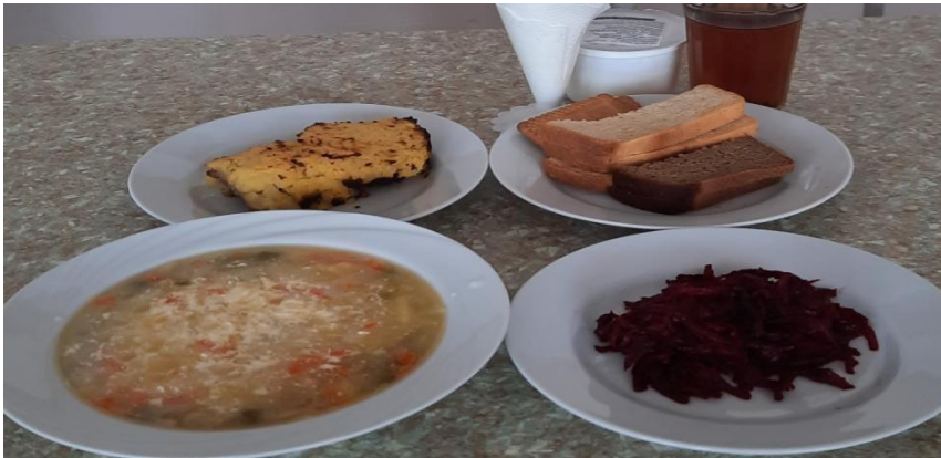
Обед ОВЗ 9.09.2024