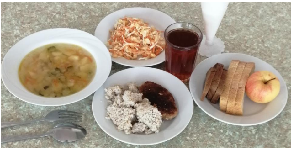
Обед ОВЗ 5.09.2024