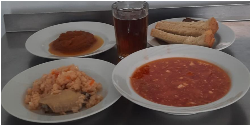
Обед ОВЗ 2.09.2024